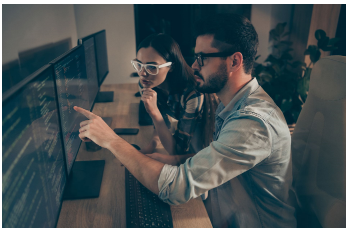
Figure 1 : La participation à l'atelier Cyber Exposure peut avoir lieu à distance ou sur site.

À la fin de l'atelier, vous recevrez une roadmap et un plan opérationnel pour votre programme de gestion des vulnérabilités, conçus spécialement pour répondre à vos objectifs de sécurité et d'entreprise.